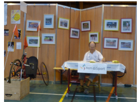
Notre stand au salon Sté Sports

Animations sportives et sensibilisations: Nous sommes toujours sollicités pour des animations sportives, des forums ou des sensibilisations diverses, en particulier dans le monde scolaire ou universitaire. Pour mémoire, ces dernières semaines, entre autres : Lycée Fauriel (basket) avec Ecole Supérieure de Commerce ; Tennis de Table avec le « groupe humanitaire » de Saint Louis (*); Collège « Les Champs » (sensibilisation dans les classes et activités partagées) ; Quinzaine « Une ville en partage » avec la ville de St Etienne; journée Festi' Sports le 28 mai à Méons ; Salon Sté Sports début septembre à la salle omnisports de la Plaine Achille (avec l'OMSS) ; collègues Jules Vallès et Marc Seguin (basket) ; les participation et intervention des aides-soignantes de l'institut de formation de la croix rouge de St Etienne au tennis de table, à la piscine et à handibasket (l'action est reconduite en 2011 2012) ; nos actions avec le Soleil Solidaire ou la section basket de l'A.L. Soleil ; etc... sans oublier les élèves de 1 ière de St Michel qui viennent au basket ou au tennis de table durant une bonne partie de la saison.