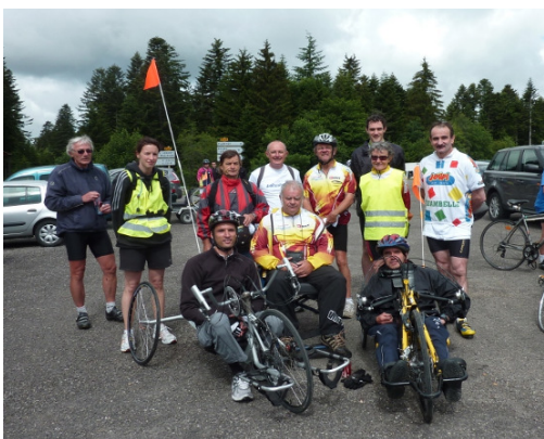
A l'arrivée de Vélocio