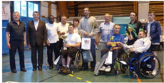
... et de la remise des récompenses.

Foot fauteuil : Rappelons que les jeunes IMC du l'IEM « les Combes de La Grange » au Chambon Feugerolles sont licenciés à Handisport par l'intermédiaire de notre club (en tant que « Centre adhérent »). Ils ont participé en 2010 2011 à la Coupe Rhône Alpes de « power chair football » (c'est-à-dire le foot fauteuil électrique...). « Les pares chocs endiablés » ont fini 5 ème sur 12. Bravo les jeunes !