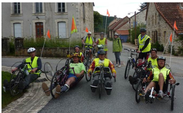
Un petit passage dans le 23, ... ça Creuse ...