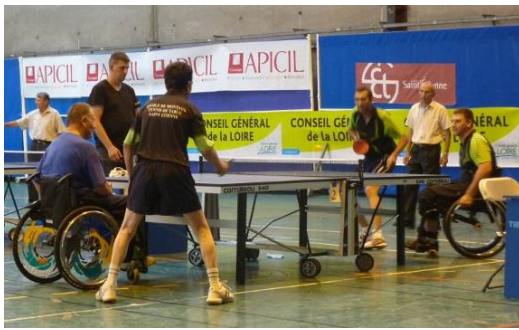
Une vue du double de la finale...