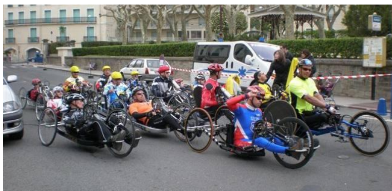
Départ de la course handcycle à Lamalou les Bains