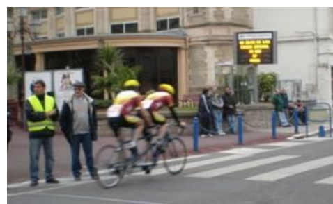
Un tandem stéphanois en course à Lamalou les Bains