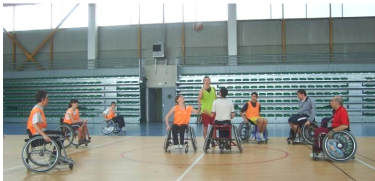
Animation basket au Lycée Claude Lebois à St Chamond