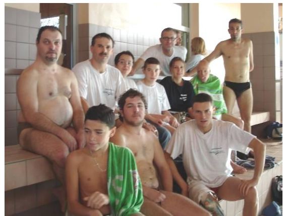
L'équipe de St Etienne Handisport à Fontaines