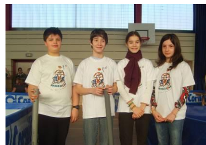
Une équipe de ramasseurs de balles.