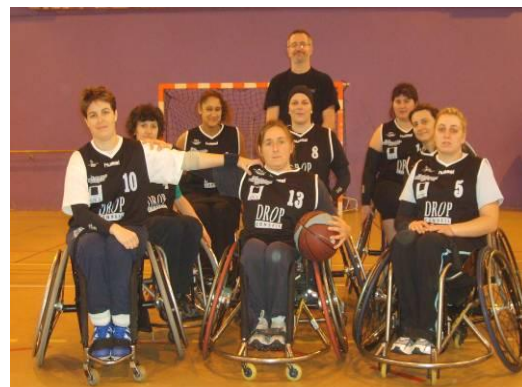
La sélection Rhône-Alpes Auvergne

Les meilleures basketteuses françaises en fauteuil roulant seront présentes à Andrézieux le samedi 17 mai à l'occasion de la Coupe de France qui regroupera 5 sélections régionales féminines : « Grand Sud Ouest », « Ile de France », « Bretagne Pays de Loire », « Est » ... et bien sûr nos filles de la sélection Rhône-Alpes Auvergne (championnes de France en 2006), avec nos basketteuses de l'Entente Feurs Saint- Etienne : Soyons nombreux à venir les encourager !